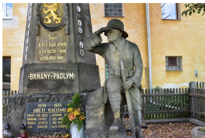
4 foto: doplněná tabulka II. sv. válka.